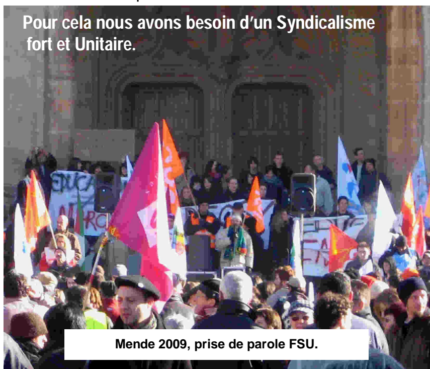
Mende 2009, prise de parole FSU.

Pour cela nous avons besoin d'un Syndicalisme fort et Unitaire.